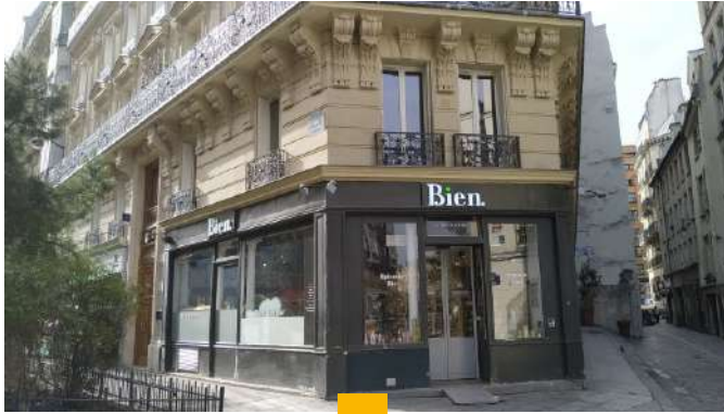
PIERRE EXPANSION SANTÉ 12 rue Lagrange - Paris (5 ème ) Locaux de 227 m 2 en copropriété Loué en 3/6/9 à Bien, l'épicerie Rendement : 4,50 % AEM Acquisition signée