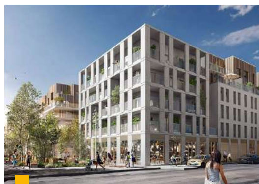
Actif situé Avenue des grésillons à Asnières-sur-Seine (92)

FIDUCIAL Gérance a des convictions thématiques, dans le commerce et on l'a prouvé depuis plus de 40 ans, dans le bureau et dans les résidences services et depuis peu dans la santé et le bien être car nous considérons que ce sont des thèmes porteurs sur le très long terme compte-tenu du vieillissement de la population. Pour nous, la santé ne va pas sans le bien-être. La santé : il faut bien entendu des soins pour le dentaire, l'optique, la vaccination, les analyses, les hospitalisations, ect..., mais cela va aussi de pair avec le bien-être : des salles de sport, des magasins bio, des crèches. Nous avons une approche assez large de la santé et celle-ci est différenciante par rapport à nos confrères. Pierre Expansion Santé fait 70 millions, elle monte en puissance, il y a une demande et nous sommes confiants dans cette SCPI qui a de belles perspectives devant elle.