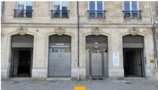
PIERRE EXPANSION SANTÉ 16 - 18 allées de Tourny - Bordeaux (33) Locaux de 166 m 2 en copropriété Loué en 3/6/9 à Accès Vision Rendement : 4,90% AEM Acquisition signée