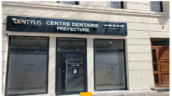
PIERRE EXPANSION SANTÉ 7 place Félix Baret - Marseille (6 ème ) Immeuble de 220 m 2 copropriété Loué en 6 ans fermes à Dentyllis Rendement : 4,90% AEM Acquisition signée