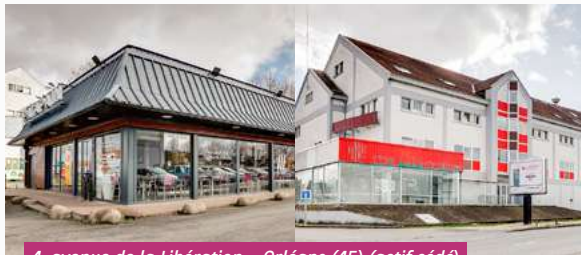
4, avenue de la Libération – Orléans (45) (actif cédé)

La distribution aux associés au 1 er semestre 2023 s'établit à 7,50 € par part au total (3,75 € par part sur chacun des deux premiers trimestres). Grâce à la vente intervenue sur l'actif d'Orléans Libération (45), et à la plus-value générée, une partie de la distribution du 2 ème trimestre a été réalisée par prélèvement sur le stock de plus-values (0,96 par part).