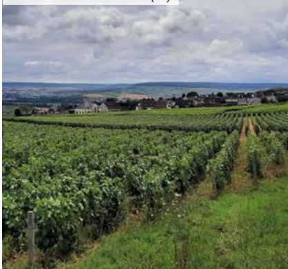
Lieudit Les Tahus - Hautvillers (51)

(2) Disponibles dans le prochain bulletin trimestriel suite à l'arrêté comptable du 31/12.