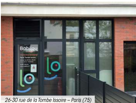
26-30 rue de la Tombe Issoire – Paris (75)