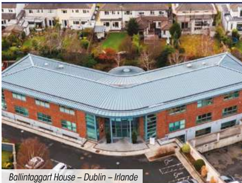
Ballinagart House – Dublin – Irlande

La SCPI n'a enregistré aucun arbitrage ce trimestre.