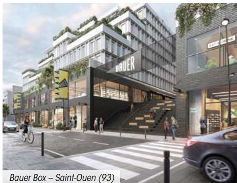
Bauer Box – Saint-Ouen (93)