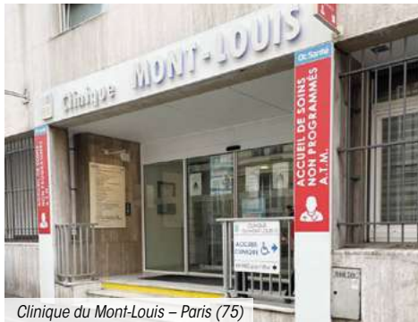
Clinique du Mont-Louis – Paris (75)