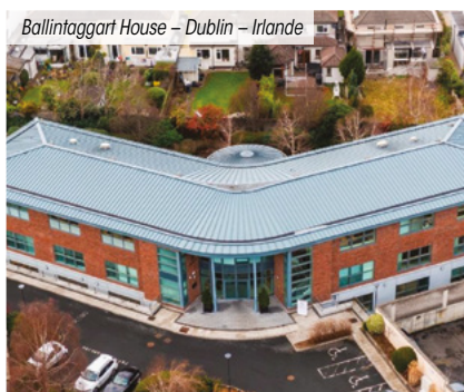
Ballinagart House – Dublin – Irlande

*** Pour les non résidents seuls les immeubles détenus sont pris en compte.