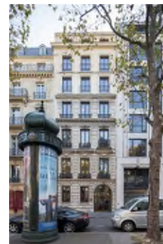
Paris 8 ème - 9, avenue de Friedland

L'achat de parts se fait par l'intermédiaire d'une confrontation des ordres d'achats et de vente tous les derniers mercredis de chaque mois (voir rubrique «Marché secondaire des parts»). A noter que le dernier mercredi du mois de décembre 2024 étant férié, la confrontation aura lieu le mardi 24 décembre (date limite de réception des ordres le vendredi 20 décembre à 16H00).