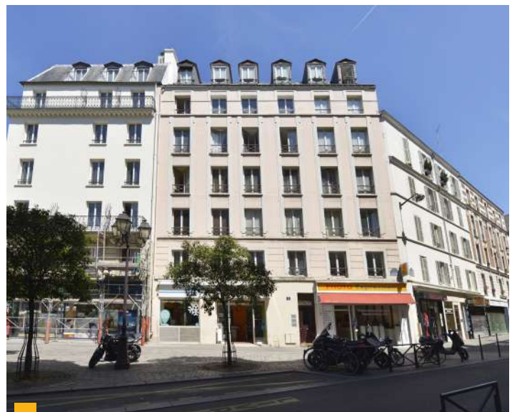
2 rue de Beccaria à Paris (75012)