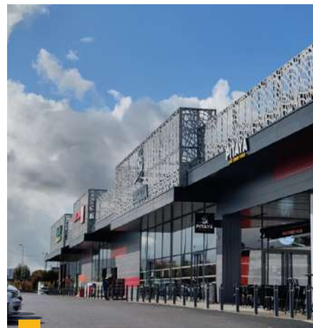
Retail Park à Tours (37)

**** Jusqu'à 2020 : TDVM. À partir de 2021 : Taux de distribution.