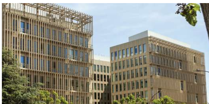
▲ 126-138 avenue de Stalingrad - VILLEJUIF (94)

Il conviendra, pour les associés désirant se porter candidat à un poste de Membre du Conseil de Surveillance et remplissant les conditions ci-dessus énoncées, de faire parvenir à la Société de Gestion avant le 31 mars 2024, un courrier de motivation indiquant leur nom, prénom, âge, le nombre de parts qu'ils possèdent, leurs références professionnelles, la liste de leurs activités au cours des 5 dernières années et de tous les mandats sociaux qu'ils exercent. Des formulaires pour postuler sont disponibles sur notre site Internet.