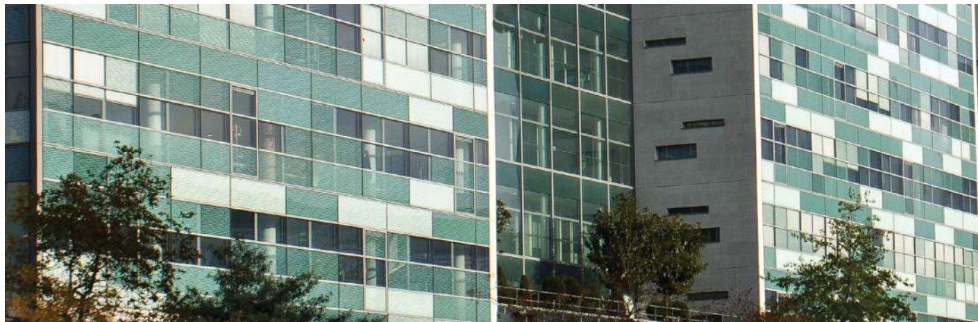
313, Terrasse de l'Arche - 92 Nanterre - Axe 13