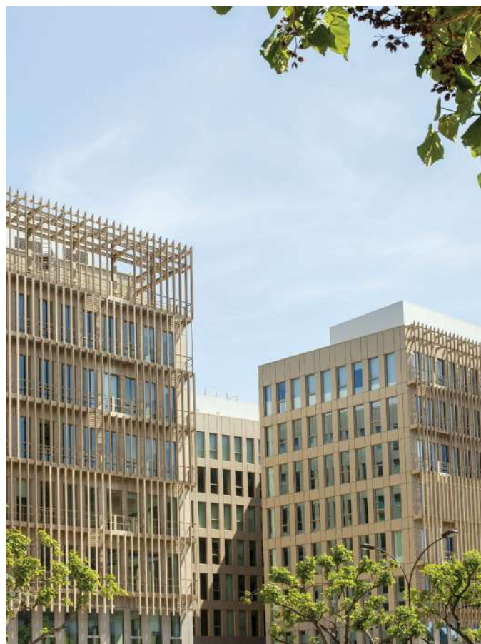
▲ 126-138 avenue de Stalingrad - VILLEJUIF (94)