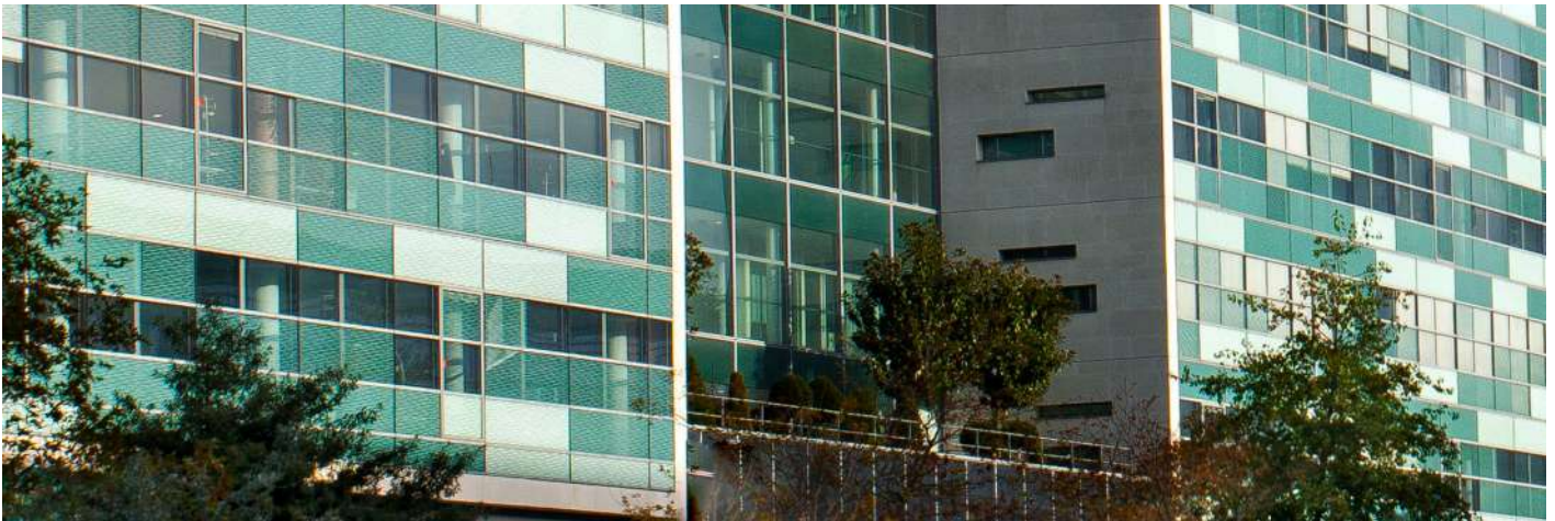
313, Terrasse de l'Arche - 92 Nanterre - Axe 13