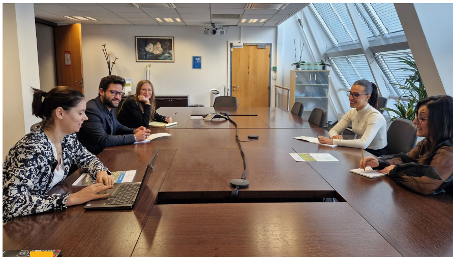
L'équipe du Service Associés chez FIDUCIAL Gérance.

Soucieux d'améliorer notre qualité de service, nous travaillons sur des nouveaux projets tels que la modernisation du site internet, de l'Espace Associés en ligne et des outils de digitalisation.