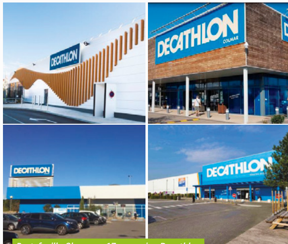
Portefeuille Olympe - 17 magasins Decathlon

S'agissant de la collecte brute du premier semestre 2022, environ 200 M€ ont été levés. Depuis le début de l'année, la collecte brute est en très forte hausse (+80 %) par rapport à 2021. Cette augmentation est liée au regain de confiance des investisseurs pour votre SCPI.