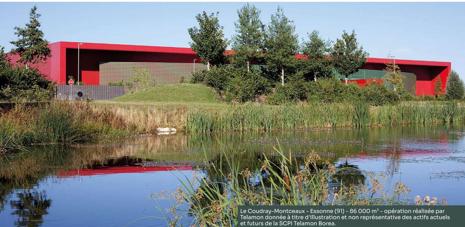
Le Coudray-Montceaux - Essonne (91) - 86 000 m 2 - opération réalisée par Telamon donnée à titre d'illustration et non représentative des actifs actuels et futurs de la SCPI Telamon Borea.