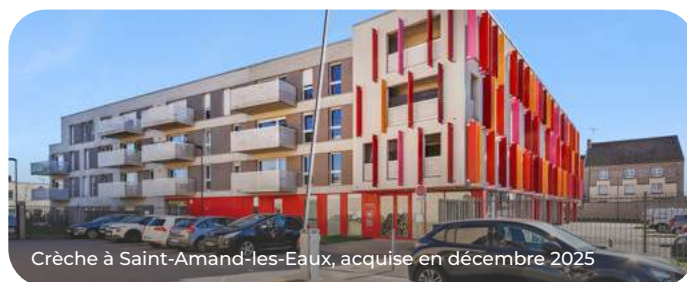
Crèche à Saint-Amand-les-Eaux, acquise en décembre 2025