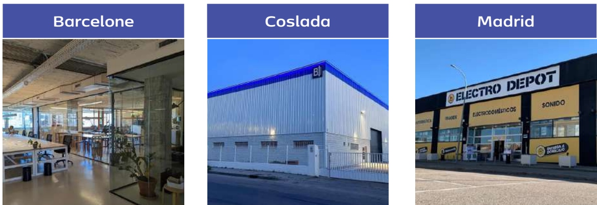
Illustration du patrimoine