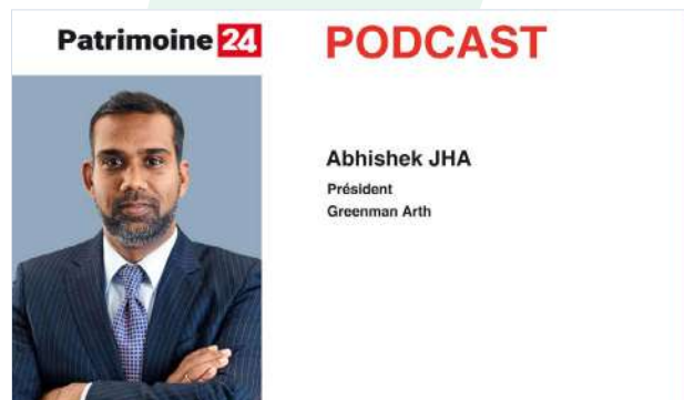
Podcast en partenariat avec Patrimoine 24