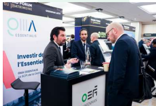
Le Grand Forum du Patrimoine 2023