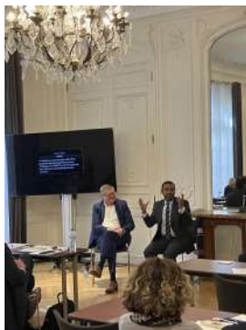
Partenariat et Road Show avec la Compagnie des CGP