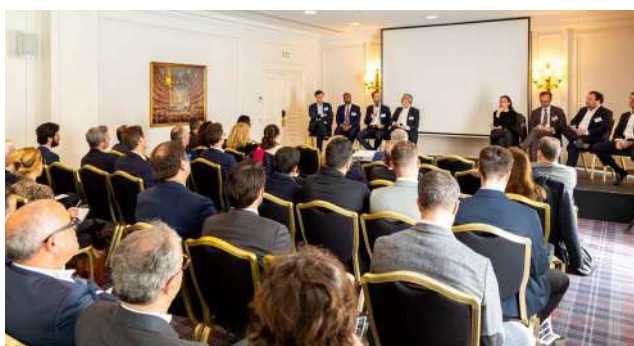
Intervention GRI France 2023