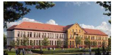
BERLIN - ALLEMAGNE - campus Unfallkrankenhaus (UKB)

La SCPI n'est engagée sur aucun endettement, pour un ratio maximum autorisé par l'Assemblée Générale de 40%, et une moyenne nationale 2025 toutes SCPI de 18,3%.