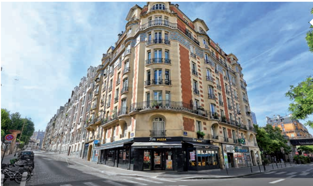
395, rue Vaugirard